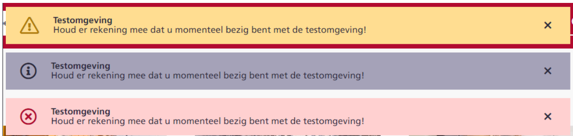
Voorbeeld Meldingen banner met een voorbeeld bericht